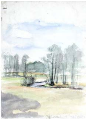
Emil Zbinden Briesetal 1. Mai 1929, 1929 Aquarell über Bleistift 27 x 20 cm, LNR 0509A Privatbesitz © Nachlass Emil Zbinden