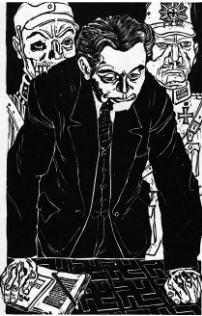
Emil Zbinden Dimitrov, 1934 Holzstich 33,6 x 25,6 cm, WVZ 38 Privatbesitz © Nachlass Emil Zbinden