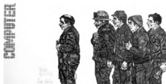
Emil Zbinden Arbeiter, 1978 Holzstich 37 x 50 cm, WVZ 204 Privatbesitz © Nachlass Emil Zbinden