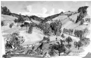
Emil Zbinden Im Emmental (bei Kappelen), 1940, ca. Tusche, laviert auf Papier 31,2 x 48,2 cm, LNR 826 Privatbesitz © Nachlass Emil Zbinden