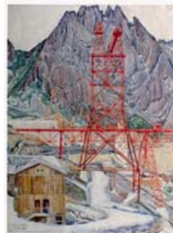
Emil Zbinden Staumauer Albigna Kabelkran 1958, 1958 Eitempera über blauer Kreide 63,6 x 48,7 cm, LNR 34 Privatbesitz © Nachlass Emil Zbinden