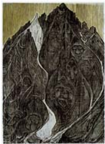
Emil Zbinden Piz Balzet, Bergell, 1958 Farbholzschnitt 65,5 x 50,4 cm, WVZ 128 Privatbesitz © Nachlass Emil Zbinden