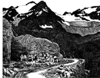
Emil Zbinden Bau der Sustenstrasse, 1941 Holzstich 39,7 x 51 cm, WVZ 94 Privatbesitz © Nachlass Emil Zbinden,