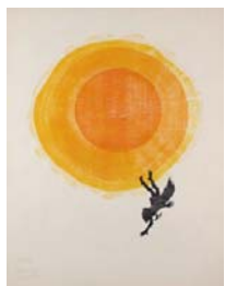
Emil Zbinden Ikarus I, 1969 Farbholzschnitt 65,5 x 50,5 cm, WVZ 176 Privatbesitz ..