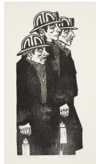
Emil Zbinden Schichtwechsel, 1959 Holzschnitt 56 x 38,4 cm, WVZ 132 Privatbesitz © Nachlass Emil Zbinden