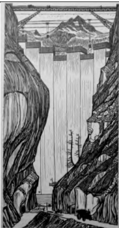
Emil Zbinden Staumauer Lienne, 1959 Holzstich 65,5 x 44,8 cm, WVZ 139 Privatbesitz © Nachlass Emil Zbinden