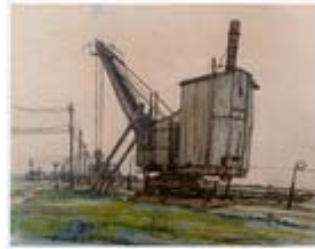
Emil Zbinden Ohne Titel (Kohlebagger), 1930 Aquarell, Farbstift und Bleistift auf Karton 38,3 x 49,7 cm, LNR 20 Privatbesitz © Nachlass Emil Zbinden